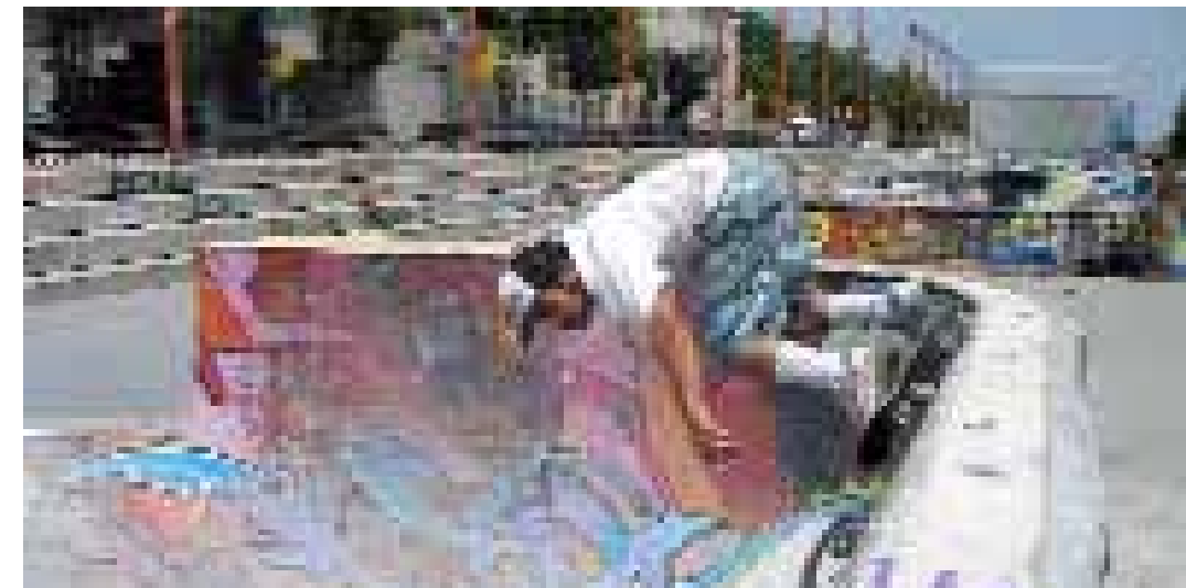
Skater a la Guineueta

Durant el 2006, amb el suport de l'Institut Barcelona Esports (IBE) i l'Agència de Gestió d'Ajuts Universitaris i de Recerca (AGAUR) i la col·laboració del Departament d'Antropologia, Filosofia i Treball Social de la Universitat Rovira i Virgili i el Departament d'Infraestructura del Transport i del Territori de la Universitat Politècnica de Catalunya, un equip del Laboratori d'Investigació Social de l'INEF de Catalunya va desenvolupar l'estudi en trenta espais més i, per tant, es van obtenir nous resultats.