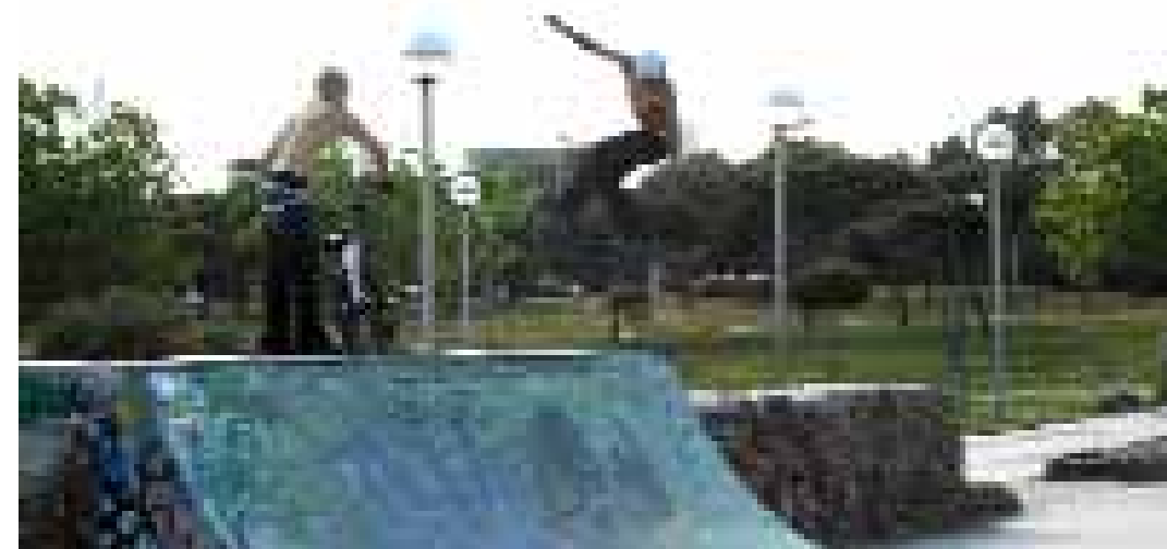
Rollers i bikers a la Mar Bella