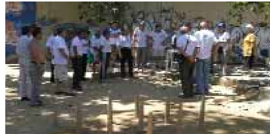
Bolos leoneses a la plaça de la Clota

En general, les formes de relació no són conflictives. Potser, en els inicis de coincidència, es varen produir friccions però s'ha arribat a acords (tenir cura de l'espai, deixar les coses com s'han trobat, etc.) destinats a facilitar la convivència. S'arriba a compromisos que, fins i tot, poden sorprendre com, per