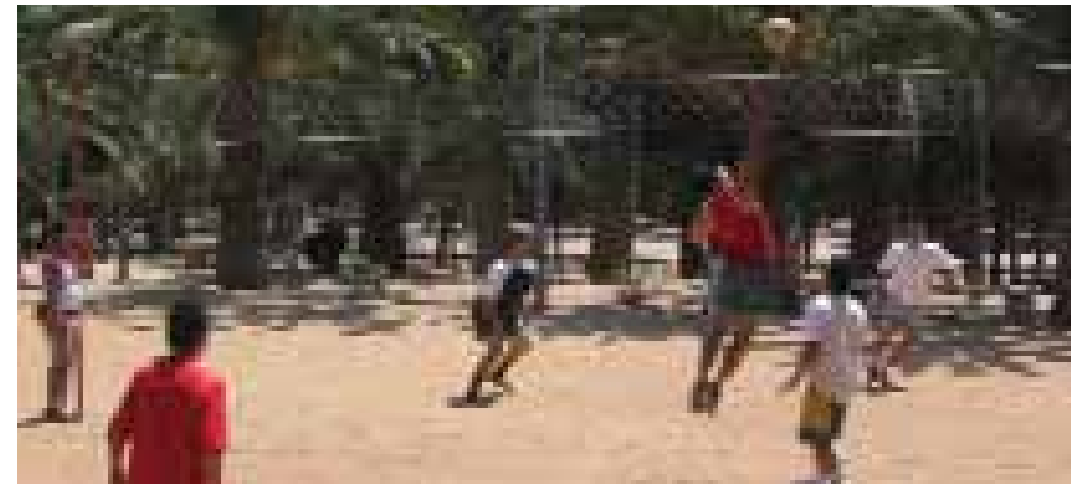
Equavòlei a l'avinguda de l'Estatut

ves i comercials transnacionals, etc. I, al mateix temps, persisteixen aquelles xarxes socials més tradicionals, basades en relacions socials duradores, amb la recreació de pràctiques pròpies d'un origen comú, de jocs de tradicions ancestrals i populars, etc. El resultat d'això representa una confluència entre tradició i postmodernitat en aquestes pràctiques esportives que tenen en l'espai públic un lloc de trobada i de representació.