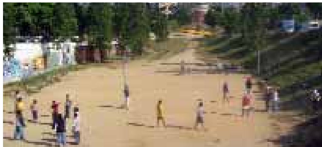
Equavòlei al Parc de l'Escorxador

Pensem que aquestes pràctiques esportives són en bona part una conseqüència de l'anomenat "estat del benestar" en una fase de desenvolupament avançat. En molts casos, la forma com es practiquen, el tipus de xarxa social que generen i l'impacte que produeixen són un reflex del que es defineix com a "postmodernitat", és a dir, relacions socials en les quals predomina un caràcter més o menys efímer, pràctiques individualitzades, basades en l'espectacularitat, promogudes per xarxes producti-